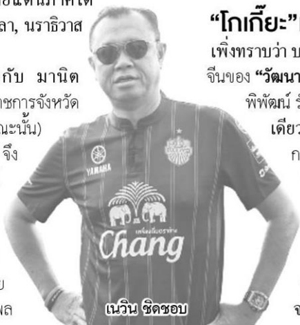
เนวิน ชาติชอบ

เนวินได้เจอกับ มานิต วัฒนเสน รองผู้ว่าราชการจังหวัดปัตตานี(ตำแหน่งขณะนั้น) รู้สึกทำงานเข้ากันดี จึงเสนอให้มานิตไปเป็นผู้ว่าราชการจังหวัดสตูล เมื่อ 1 ตุลาคม 2547 ซึ่งเป็นช่วงที่นโยบายจับปละผู้ค้าผู้มีอิทธิพล