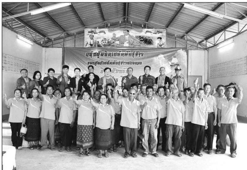
ดูงาน : นายประภัตร โพธสุธน รัฐมนตรีช่วยว่าการกระทรวงเกษตรฯ เยี่ยมชมกลุ่มผู้ผลิตเมล็ดพันธุ์ข้าวบ้านช้างมิ่ง ซึ่งประสบผลสำเร็จในการจัดทำแปลงขยายพันธุ์ข้าวในฤดูฝน ปี 2560 ถึงฤดูฝน ปี 2562 สามารถจำหน่ายเมล็ดพันธุ์ข้าวคืนให้ศูนย์เมล็ดพันธุ์ข้าวสกลนครได้ร้อยละ 168.63 ของเป้าหมายซื้อคืน ณ กลุ่มผู้ผลิตเมล็ดพันธุ์ข้าวบ้านช้างมิ่ง ต.ช้างมิ่ง อ.พรรณานิคม จ.สกลนคร เมื่อเร็วๆ นี้

“เป้าหมายการผลิตเมล็ดพันธุ์ข้าวในปีต่อไป รัฐบาลและกระทรวงเกษตรฯมีนโยบายเพิ่มศักยภาพการผลิตเมล็ดพันธุ์ข้าวคุณภาพดีให้สอดคล้องกับความต้องการของชาวนา กรมการข้าวโดยศูนย์เมล็ดพันธุ์ข้าวที่มีทั่วประเทศ 29 แห่ง ได้ประชุมวางแผนให้ผลิตเมล็ดพันธุ์ข้าวให้ได้ 260,000 ตัน ภายในปี 2565 โดยแบ่งเป้าหมายการผลิตออกเป็น 3 ปี คือ ปี 2563 เป้าหมาย 150,000 ตัน