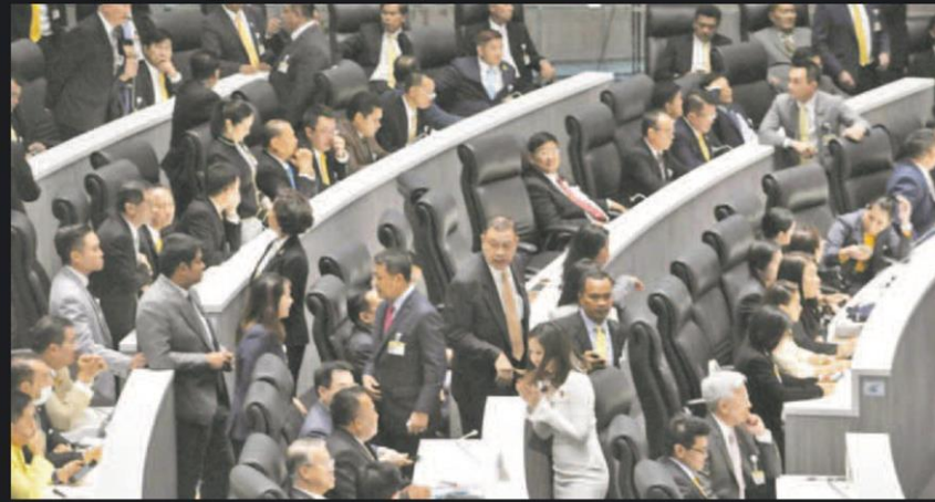
■ วัน ■ บรรยากาศการประชุมสภาผู้แทนราษฎร เกิดความวุ่นวายในการพิจารณาญัตติของ ส.ส.รัฐบาลที่ให้นับคะแนนใหม่ กรณีการตั้งคณะกรรมการวิสามัญศึกษาผลกระทบจากคำสั่ง คสช.ตาม มาตรา 44 เมื่อวันที่ 4 ธ.ค.